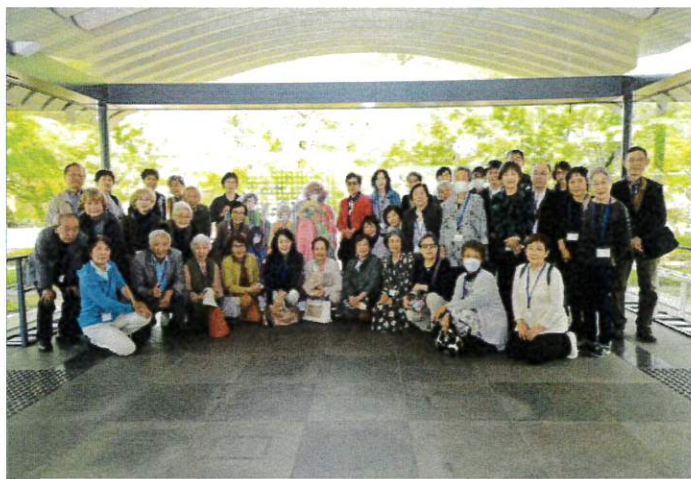
源氏物語ミュージアムでの集合写真