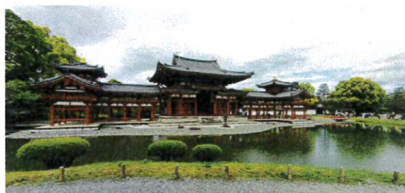
平等院鳳凰堂 正面