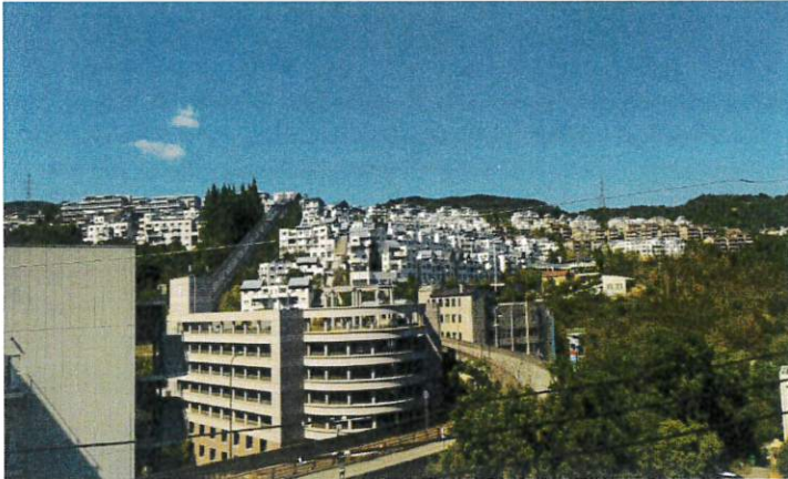
国道176号線からナシオン全景