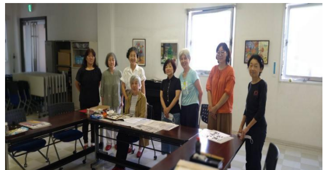
2024. 7. 4. 書道部活動メンバー