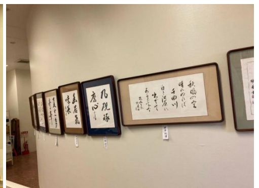
2023 年度のナシオンホールにての作品展示状況