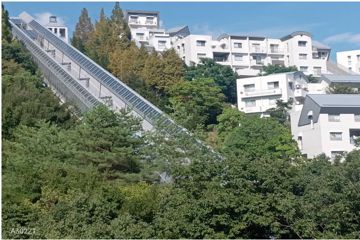
JR西宮名塩駅付近より高台の東山台中心部へ『斜行エレベーター』で約60mの高低差を上る