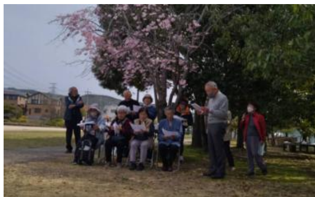
2024.4.5. 花見会場での発表活動

「楽しく歌って元気になる」をモットーに和気あいあいと活動していますので、歌の好きな方はもちろん、苦手という方もぜひ一度見学に来てください。お待ちしております。