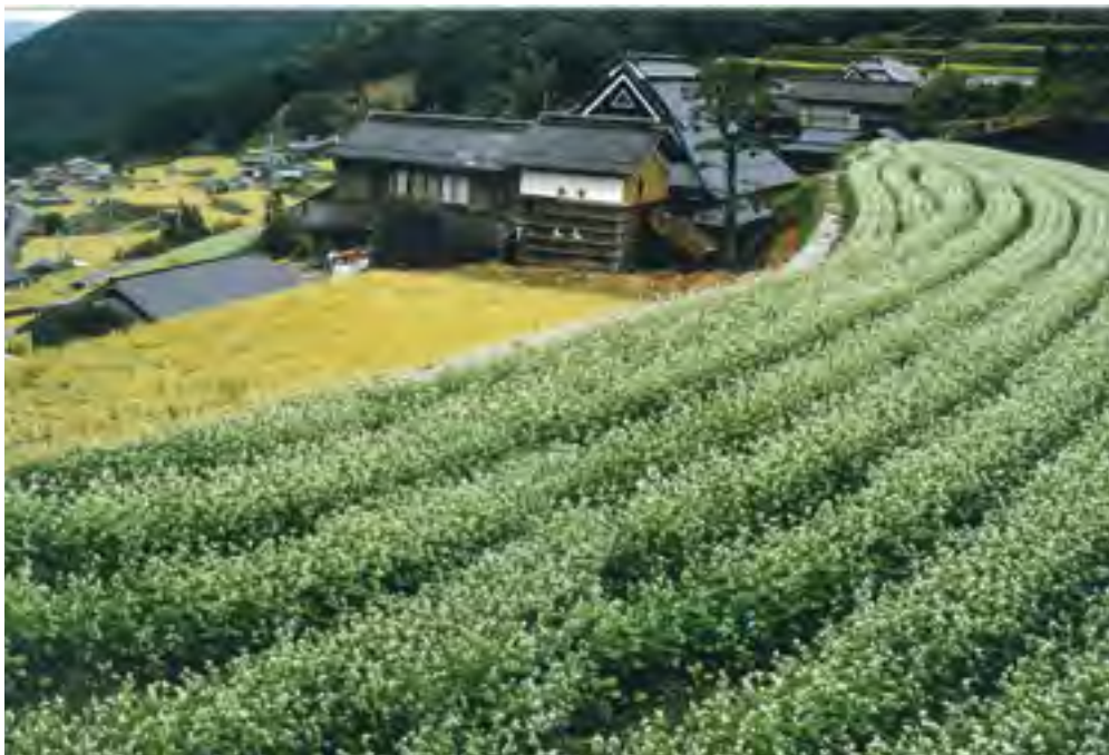
養父市八鹿町の蕎麦畑 写真と文 田中 積氏 (用海校区)

稲穂が頭を垂れるころ 白い花が満開となる蕎麦畑 蕎麦の歴史は古く 昔から長寿食といわれ 生活習慣病予防 肝臓の保護効果等など 素晴らしい食物といわれている