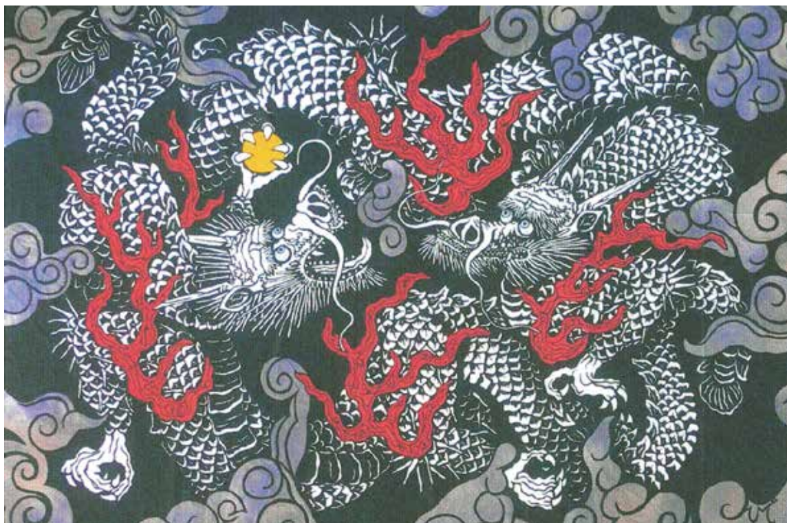
「建仁寺 双龍図」 切り絵 川条 秀和氏 (名塩校区)

2002年の建仁寺創建600年を記念して 小泉淳作画伯が2年の歳月をかけて 描かれた大作です 少し表情が可愛く思えますが、 畳108畳分の大きさは壮大です