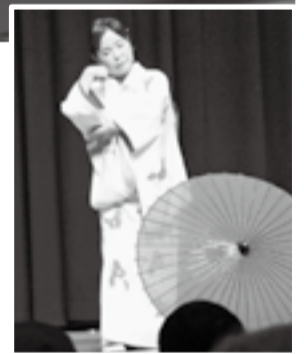
※写真は全て前回の様子