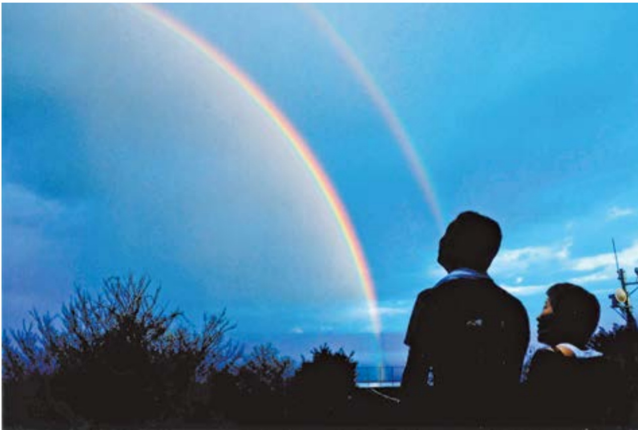
愛媛県大島 (しまなみ海道) 亀老山にて 写真と文提供 田中 積氏 (用海校区)

自然界が生み出す神秘的現象 虹 夢や希望をのせて光る 虹 奇跡的な二筋の虹の美しさに しばし見とれ明日を生きる糧としたい