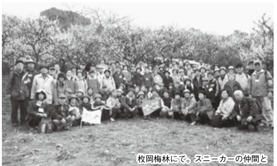
枚岡梅林にて。スニーカーの仲間と

「スニーカー」に注力する一方、笠屋町老人クラブでも活躍する会長。クラブでは年に数回、誕生会や敬老会を開き、グラウンド・ゴルフやカラオケサークル